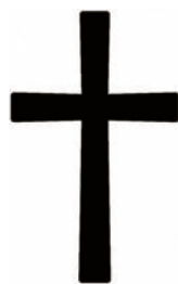
Christoph Schmolz 1. Bürgermeister