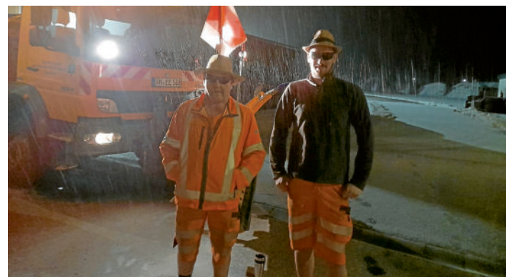
Foto: Trotz kurzer Nächte – unsere Mitarbeiter im sommerlichen Outfit, mit Humor bei der Arbeit

Die Gemeinde fordert nicht nur von Ihren Bürgerinnen und Bürgern die Einhaltung der Winterdienstpflichten. Sie sorgt auch selbst mit allen verfügbaren Kräften und Fahrzeugen für schnellst-