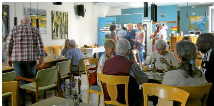
Fairer Genuss im Bürgertreff

Mit über 40 Besucherinnen und Besuchern stieß das öffentliche Faire Frühstück im Bürgertreff Neuendettelsau auf große Resonanz. Eingeladen hatten anlässlich der bundesweiten Aktion „Fair in den Tag“ die Fairtrade Steuerungsgruppe Neuendettelsau, der Weltladen sowie das Bündnis für Familie. Das gemeinsame Frühstück brachte Menschen miteinander ins Gespräch und bot eine Gelegenheit Kontakte zu knüpfen.