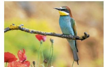
Bienenfresser ( Merops apiaster )

Wer in Neuendettelsau und Umgebung aufmerksam durch Gärten, Felder oder Wälder geht, kann Veränderungen in der Vogelwelt beobachten. Der Klimawandel wirkt sich zunehmend auch auf heimische Vogelarten aus – manche profitieren von milderen Temperaturen, andere geraten dagegen stark unter Druck. Auch der Vogelschutzverein Neuendettelsau und Umgebung e.V. nimmt Veränderungen wahr: