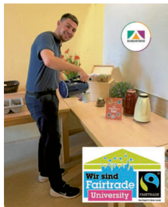
Auch die Studentinnen und Studenten an der Augustana-Hochschule frühstückten „fair“

Das reichhaltige Buffet bestand neben Produkten des Fairen Handels wie Getränken oder Bananen aus Aufstrichen mit bio und regionalen Zutaten. Ob Kaffee, Tee, Kakao, Banane oder Honig – Frühstücksprodukte mit dem Fairtrade-Siegel stehen für bessere Arbeitsbedingungen für Produzenten und Beschäftigte. So können die Produzenten mit stabilen Preisen rechnen und erhalten zusätzliche Prämien, die in klimaresistenten Anbau, Trainingsprogramme, Gesundheitsversorgung und Bildungs-