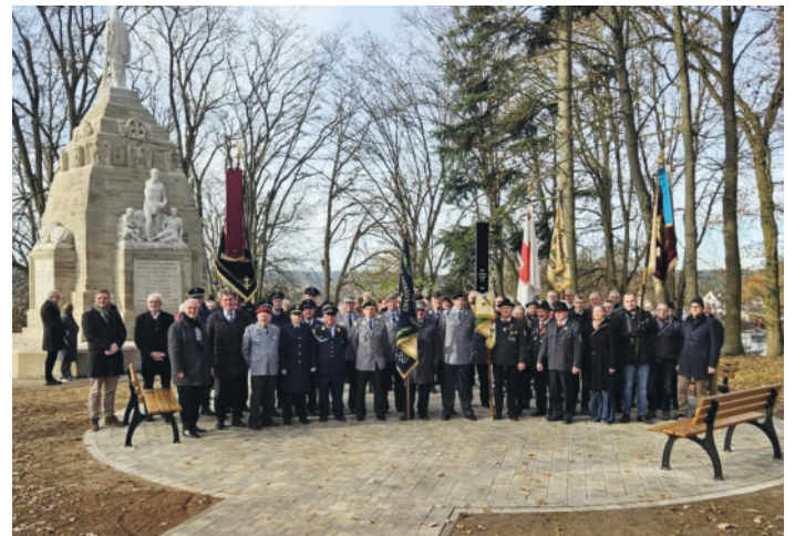
Gedenkfeier zum Volkstrauertag in Windsbach