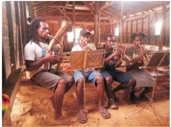
1. Preis: Posaunenchor im Hochland von Papua-Neuguinea.

Der 1. Preis wird von Mission EineWelt mit 300 Euro prämiert, der 2. Preis mit 200 Euro und der 3. Preis mit 100 Euro.