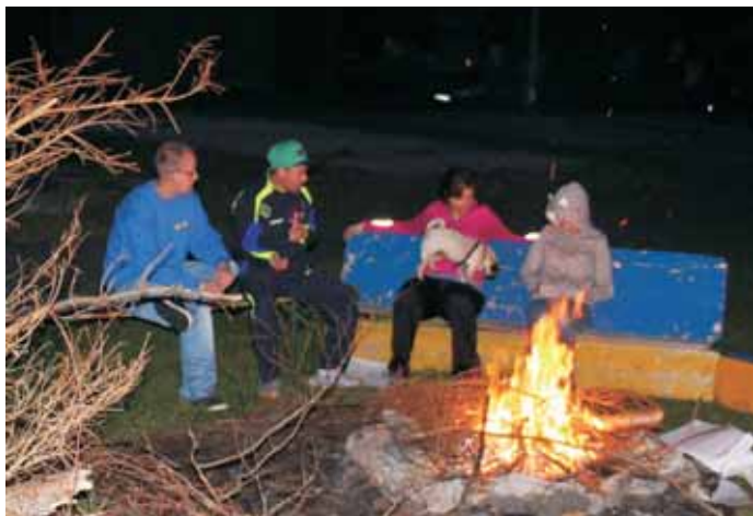
Freundschaften wurden vor allem am Lagerfeuer geschlossen.

ten Schlafdefizit bei dem Ein oder anderen. Welches auf der ebenso nicht ganz so kurzen Heimfahrt, nachgeholt werden konnte. Gut zu Hause angekommen, lassen sich die 3 Tage als wertvolle Zeit zum intensiven Austausch und sich näher kommen verstehen, die keiner hätte missen wollen.