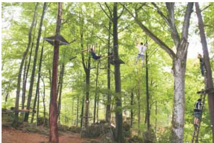
Die Mojusanler hatten im Kletterpark Betzenstein viele Herausforderungen zu überwinden.

Wir aber stellten erst am Schluss der Route fest, dass wir so gleich mit dem höchsten Schwierigkeitsgrad begonnen hatten. Doch mit gegenseitiger Hilfe und Ermutigung konnte auch dies geschafft werden. Außerdem erlebten wir von oben die Natur aus einer anderen Perspektive und ließen uns einen anderen Blick auf die Welt werfen. Ein Highlight war für viele noch, die über 100m lange Seilrutsche über das benachbarte Schwimmbad. Hier fühlte man sich leicht wie ein Vogel & ein Bisschen fliegen wie Superman war auch dabei. Bei der letzten Station