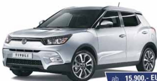
Abb. zeigt kostenpflichtige Sonderausstattung

ab 15.900,- EUR 1 inkl. 5 JAHRE GARANTIE 2