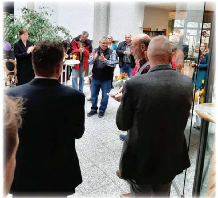
Text Eckard Dürr, Bild: Rudolf Kupser

Der Bürgertreff steht jetzt jeweils dienstags und donnerstags von 14 bis 17 Uhr sowie freitags von 15.30 bis 18.30 Uhr allen Interessierten offen. Ferner können Vereine, Gruppen und Parteien den Raum für Veranstaltungen reservieren. Kalender und Kontakt über die Homepage buergetreff-neuendettelsau.de