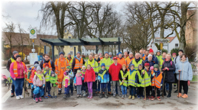
Einige der Neuendettelsauer Helferinnen und Helfer

Findet das Müllsammeln wie geplant statt, regnet es, kommen HelferInnen? Es blieb spannend bis zum Schluss. Samstag früh, kein Regen und bis 9 Uhr haben sich etwa 50 UnterstützerInnen für die Säuberungsaktion am Sternplatz eingefunden. Der TSC hat wieder tatkräftig in den verschiedenen Abteilungen dafür geworben und war mit vielen Jugendlichen, Kindern, Eltern und Gruppenleitungen dabei. Die Teilnehmer vom CSU Ortsverband brachten selbst gemachte „Spießler“ mit, die bei den Kids guten Anklang fanden. Ausgerüstet mit Handschuhen, Warnwesten und blauen Säcken ging es in die verschiedenen Richtungen zum Sammeln. Für die Organisatorin der Gemeinde begann nun auch die Arbeit, ausreichend Essen und Getränke für alle zu beschaffen. Gegen Mittag trafen sich die SammlerInnen im Wertstoffhof zum Sortieren und Entsorgen anschließend durften sich alle bei einem Imbiss stärken. Herzlichen Dank allen Freiwilligen, auch aus den verschiedenen Ortsteilen. Einige hatten sich mit ihren Dorfgemeinschaften wieder beteiligt bzw. werden demnächst noch unterwegs sein.