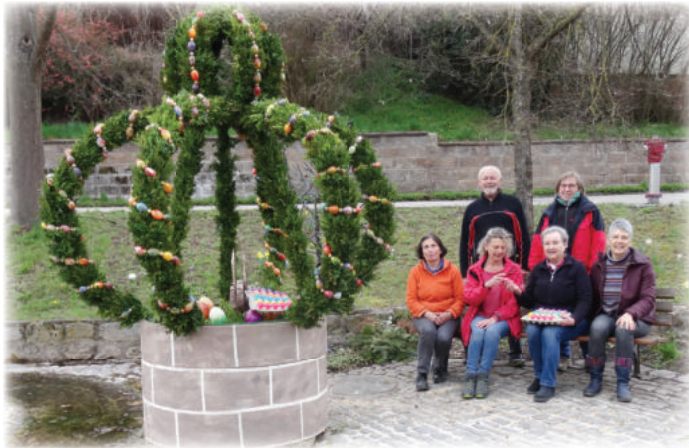
Text/Bild Erwin Jungmann

Auch zur Osterzeit 2023 haben die Mitglieder des Obst- und Gartenbauvereins Aich wieder die Osterkrone geschmückt. An alle Helferinnen und Helfer, die sich beim Buschschneiden und Binden der Krone beteiligten ein herzliches Dankeschön vom Vorstand. Ein herzlicher Dank geht auch an einen örtlichen Betrieb für die gespendeten Ostereier.