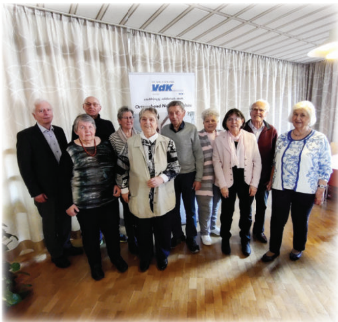
Text/Fotos: Ingrid Herrmann, Maria Bauer

Gelegenheit zum Plaudern und gemeinsamen Kaffeetrinken ergab sich für die 52 Anwesenden im Anschluss an die abgearbeitete Tagesordnung. Viele waren bereits in Gedanken bei der Vorbereitung der Sechs-Tage-Fahrt. Sie führte in diesem Jahr an die Nordküste der Niederlande, zur Tulpenblüte und weitere spannende Städte Nordhollands.