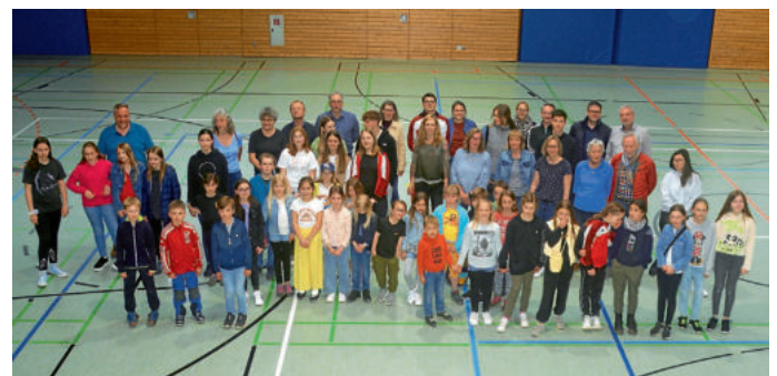
Die fittesten Neuendettelsauer/innen 2022

Sport hält gesund und bringt Menschen zusammen. Das sind zwei gute Gründe, um für das Sportabzeichen zu trainieren. Und natürlich ist es ein wunderbares Gefühl, wenn man sein Abzeichen schließlich in den Händen hält.