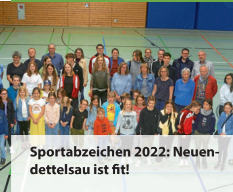
Sportabzeichen 2022: Neuendettelsau ist fit!