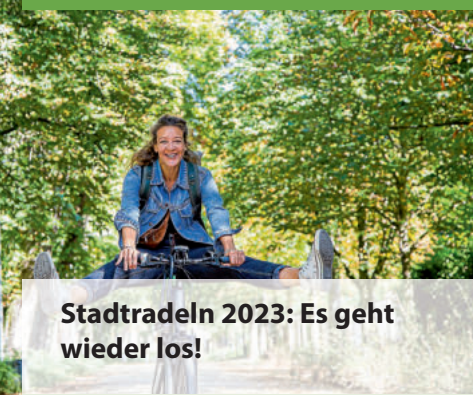
Stadtradeln 2023: Es geht wieder los!