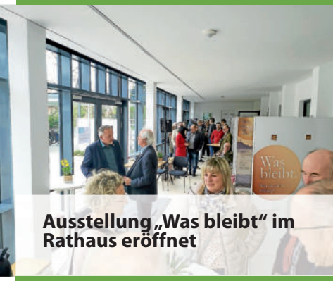
Ausstellung „Was bleibt“ im Rathaus eröffnet