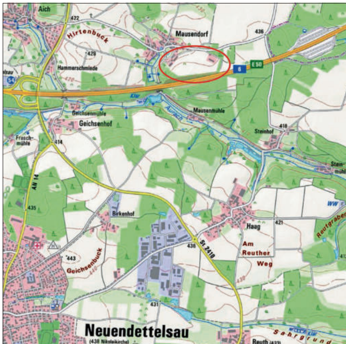
Kartenausschnitt mit Änderungsbereich (Kartengrundlage Bayerische Vermessungsverwaltung 2022)

Planungssicherstellungsgesetz (PlanSiG) i. V. m. § 4a Abs. 4 BauGB auf der Homepage der Gemeinde Neuendettelsau ( www.neuendettelsau.eu ) zur Einsicht zur Verfügung gestellt unter der Rubrik „Leben & Gewerbe“, „Bauen & Wohnen“, „Bauleitplanung“. Während der Auslegungsfrist können die Planunterlagen eingesehen werden und es wird der Öffentlichkeit Gelegenheit zur Äußerung und Erörterung gegeben. Hierbei können Anregungen und Bedenken in Textform oder mündlich zur Niederschrift vorgetragen werden. Da das Ergebnis der Behandlung der Stellungnahmen mitgeteilt wird, ist die Angabe des Verfassers zweckmäßig.