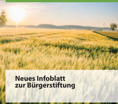
Neues Infoblatt zur Bürgerstiftung