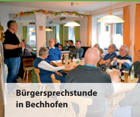
Bürgersprechstunde in Bechhofen