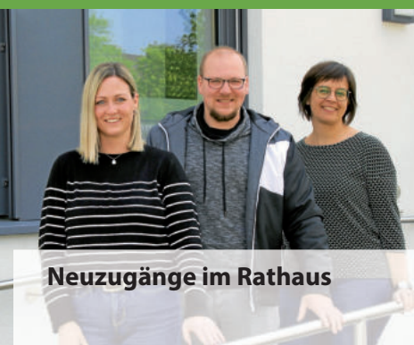
Neuzugänge im Rathaus