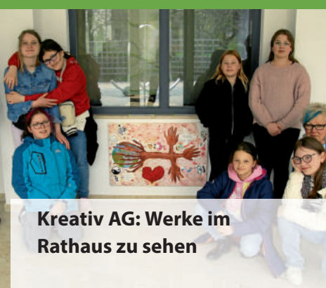
Kreativ AG: Werke im Rathaus zu sehen