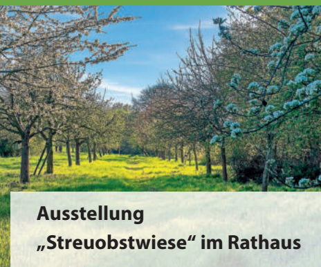
Ausstellung „Streuobstwiese“ im Rathaus