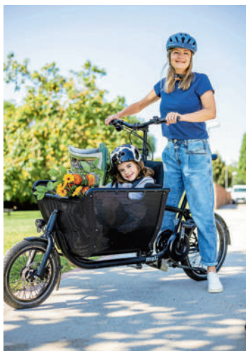
Pedelecs und Lastenräder mit E-Motor-Unterstützung dürfen auf Radwegen fahren

Das mit dem Wetter, das war so eine Sache beim Stadtradeln in diesem Jahr... Wir hatten echt Pech! Der Aktionszeitraum in Neuendettelsau vom 27. Mai bis 16. Juni fiel genau in jene besonders regenreiche Zeit, die anderen Regionen in Bayern verheerende Überflutungen beschert hat. Daher ist es vielleicht nicht verwunderlich, dass wir in diesem Jahr weniger aktiv Teilnehmende beim Stadtradeln hatten als in den Jahren zuvor: 313 (2023: 408). Und auch die Gesamtkilometerzahl fiel geringer aus: 65.905 Kilometer (2023: 93.057 km). Selbst das gemütliche Beisammensein am Sportpark zum Abschluss der Aktion mit Ehrung der aktivsten Radlerinnen und Radler geriet wegen eines vorherigen Gewitterschauers zu einer etwas übersichtlichen Veranstaltung.