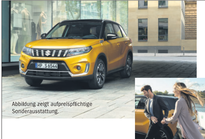
Abbildung zeigt aufpreispflichtige Sonderausstattung.