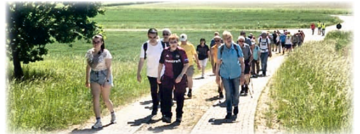
Ein Teil der aktiven Wanderer auf ihrem Weg durch die Sachsener Flur

Neuses 74 • 91575 Windsbach Tel.: 09871 -706 25 20