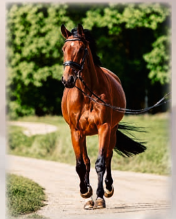
Unser Schulpferd „Sid“

Text + Foto: Ulrike Hirschmeier / Reitverein Neuendettelsau