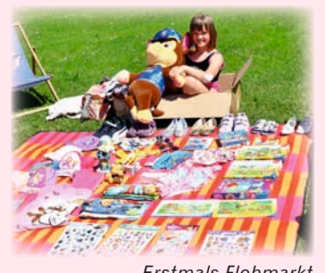
Erstmals Flohmarkt von Kindern für Kinder

Staubige Pflasterarbeiten für Mähroboter-Garage und viele fleißige Ehrenamtliche auf dem gesamten Gelände